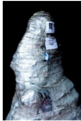
Reichtum, Lhasa - Künstler: Bernard Langerock