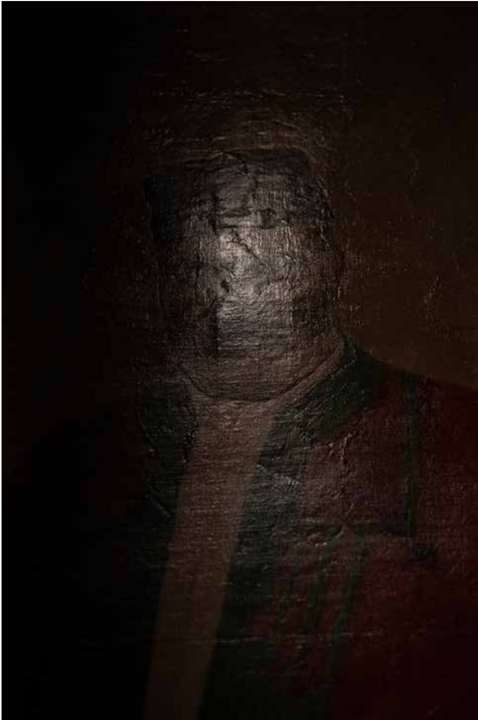
Musée d'Art et d'histoire du Judaïsme, Paris 2025