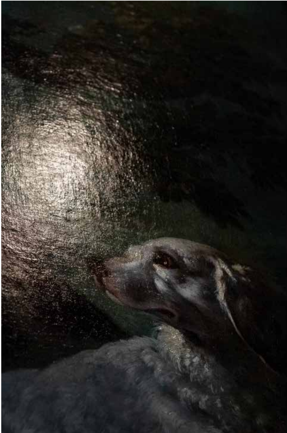
Musée de la chasse et de la nature, Paris 2025