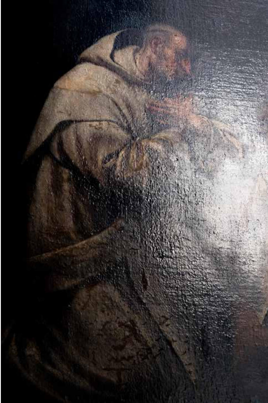
Église St. Merry, Paris 2025