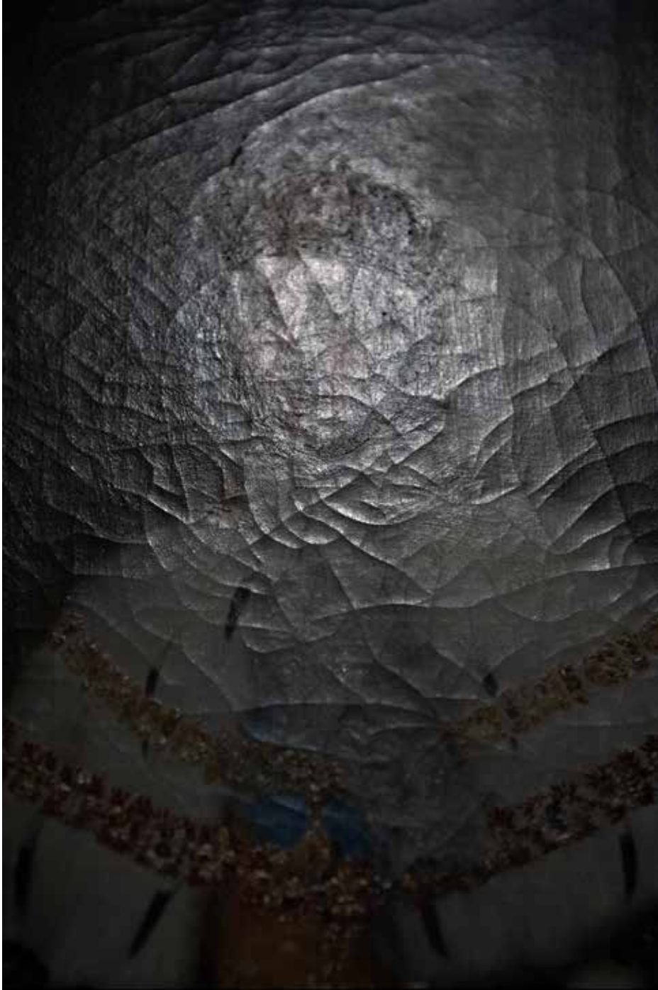
Musée Manufacture nationale des Gobelins I, Paris 20255