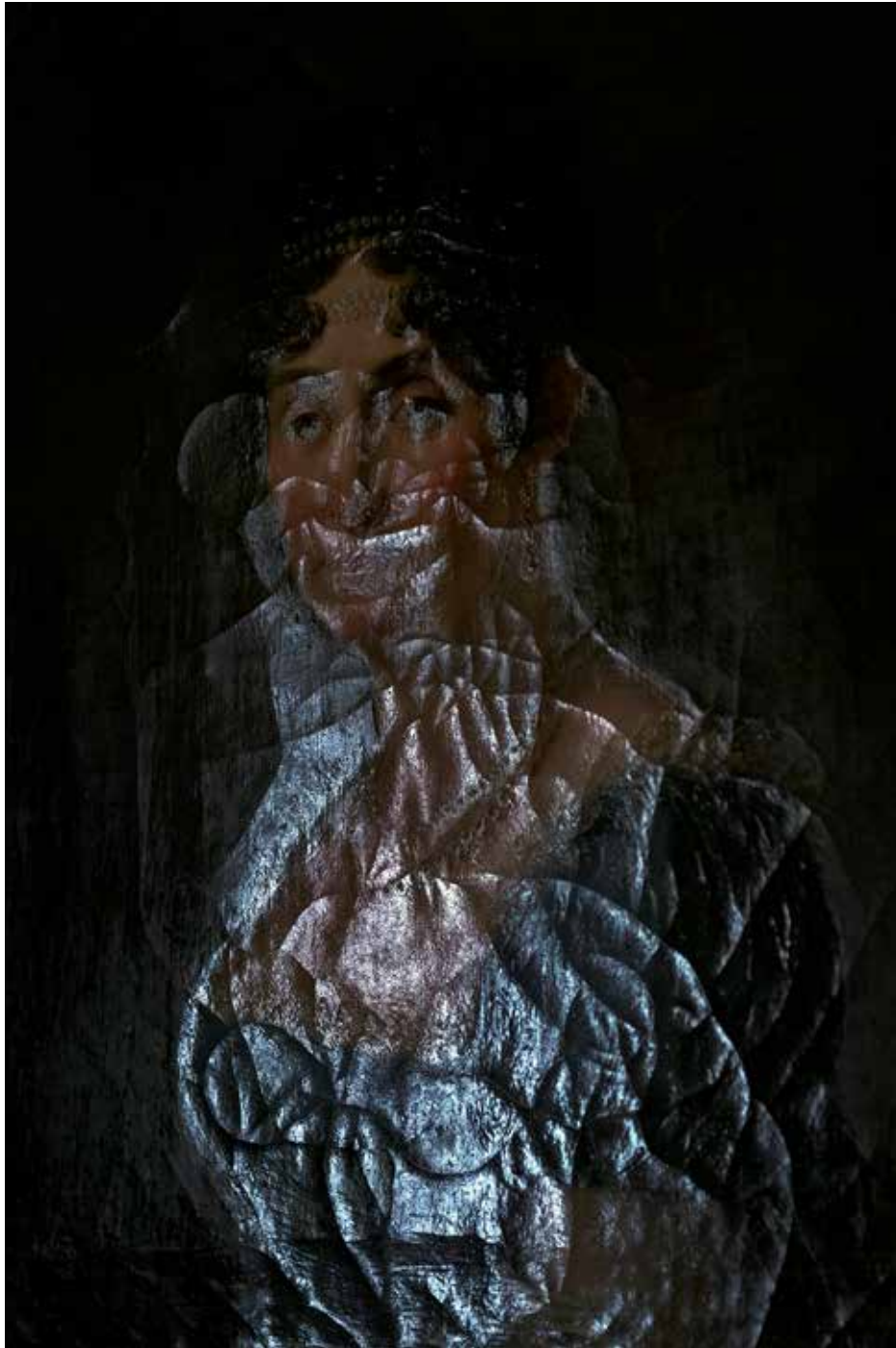
Musée Marmottan, Paris 2025