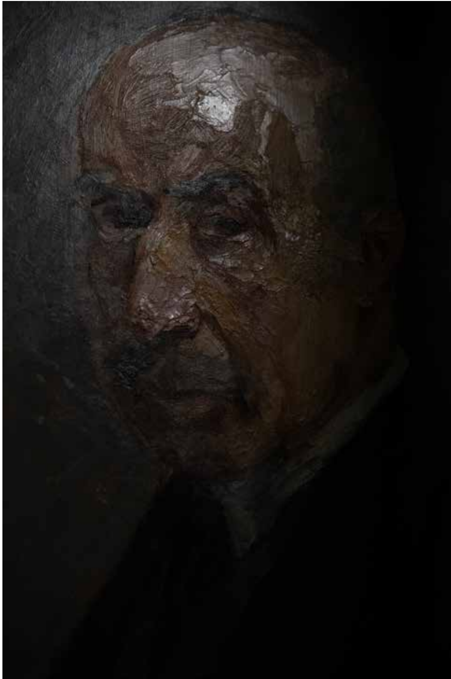
Musée d'Art et d'histoire du Judaïsme, Paris 2025