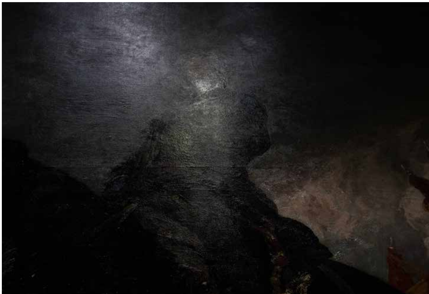
Musée d'Orsay 2, Paris 2025