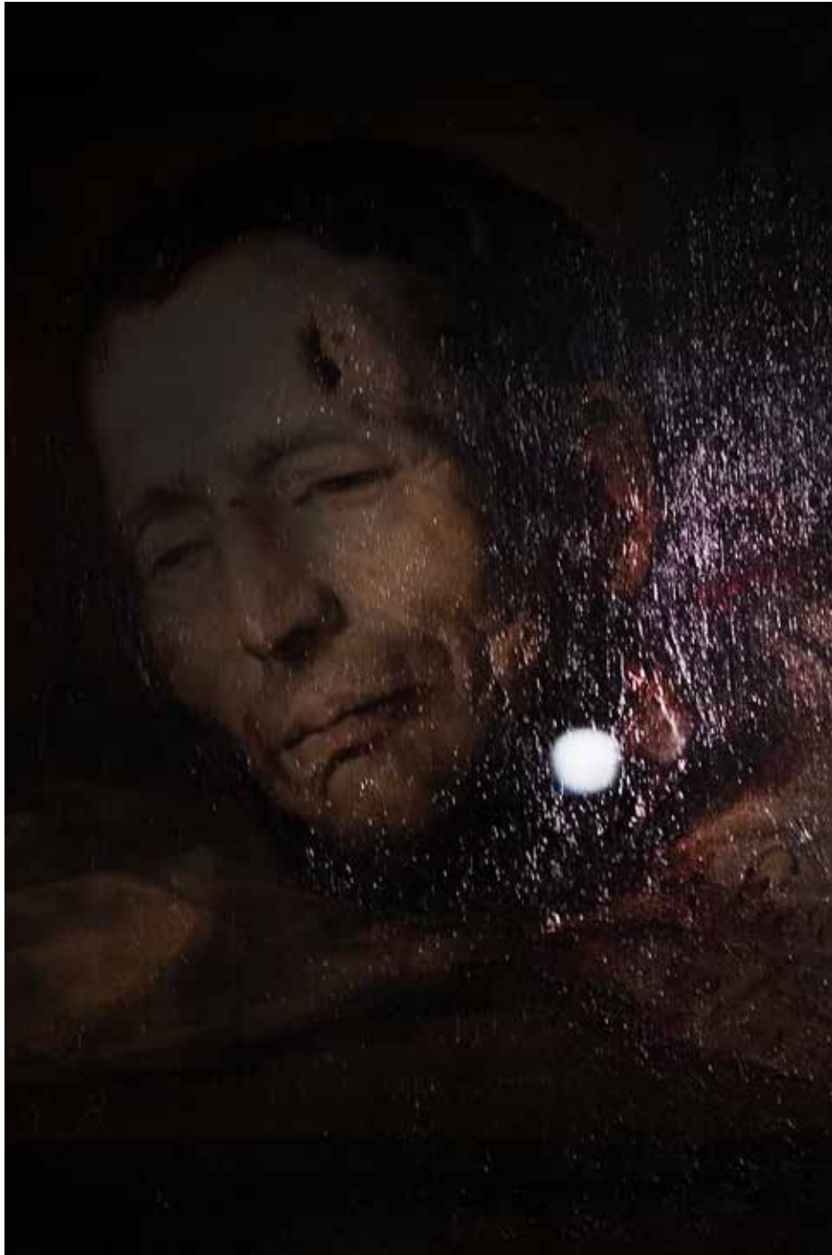
Chateau de Fontainebleau, Fontainebleau 2022