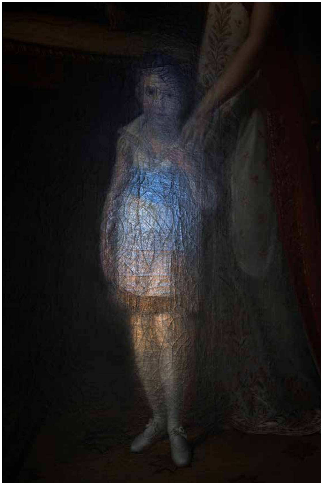
Chateau de Fontainebleau, Fontainebleau 2022

Erst ter plaatse 2, Parijs en Fontainebleau, Frankrijk, 2022 en 2025