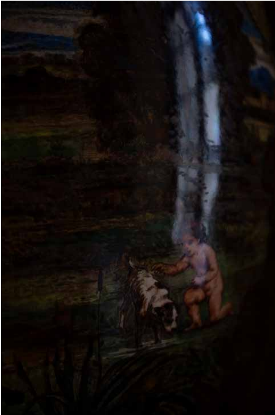
Chateau de Fontainebleau 2, Fontainebleau 2022