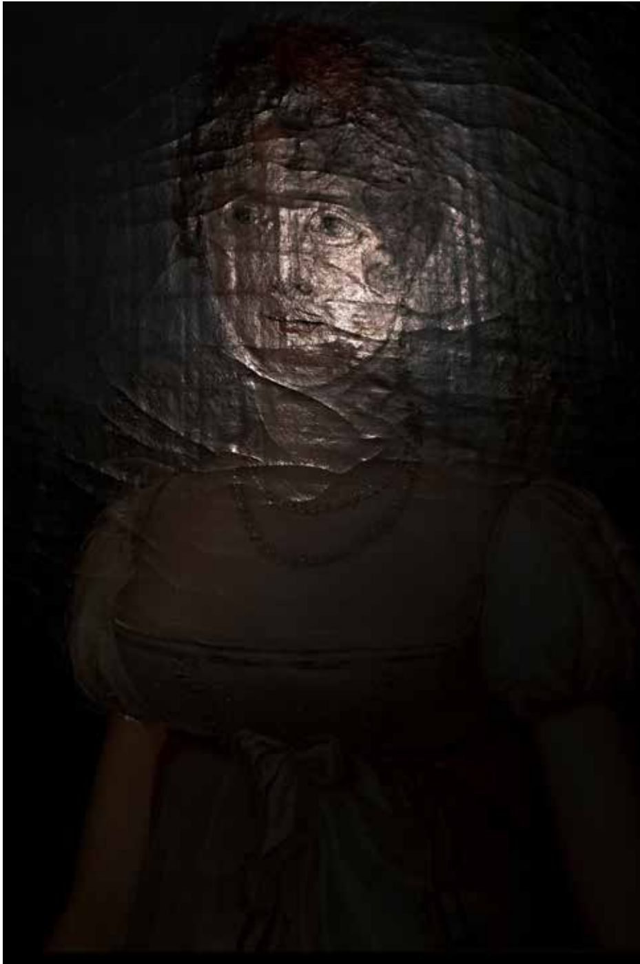
Musée Marmotton 2, Paris 2025