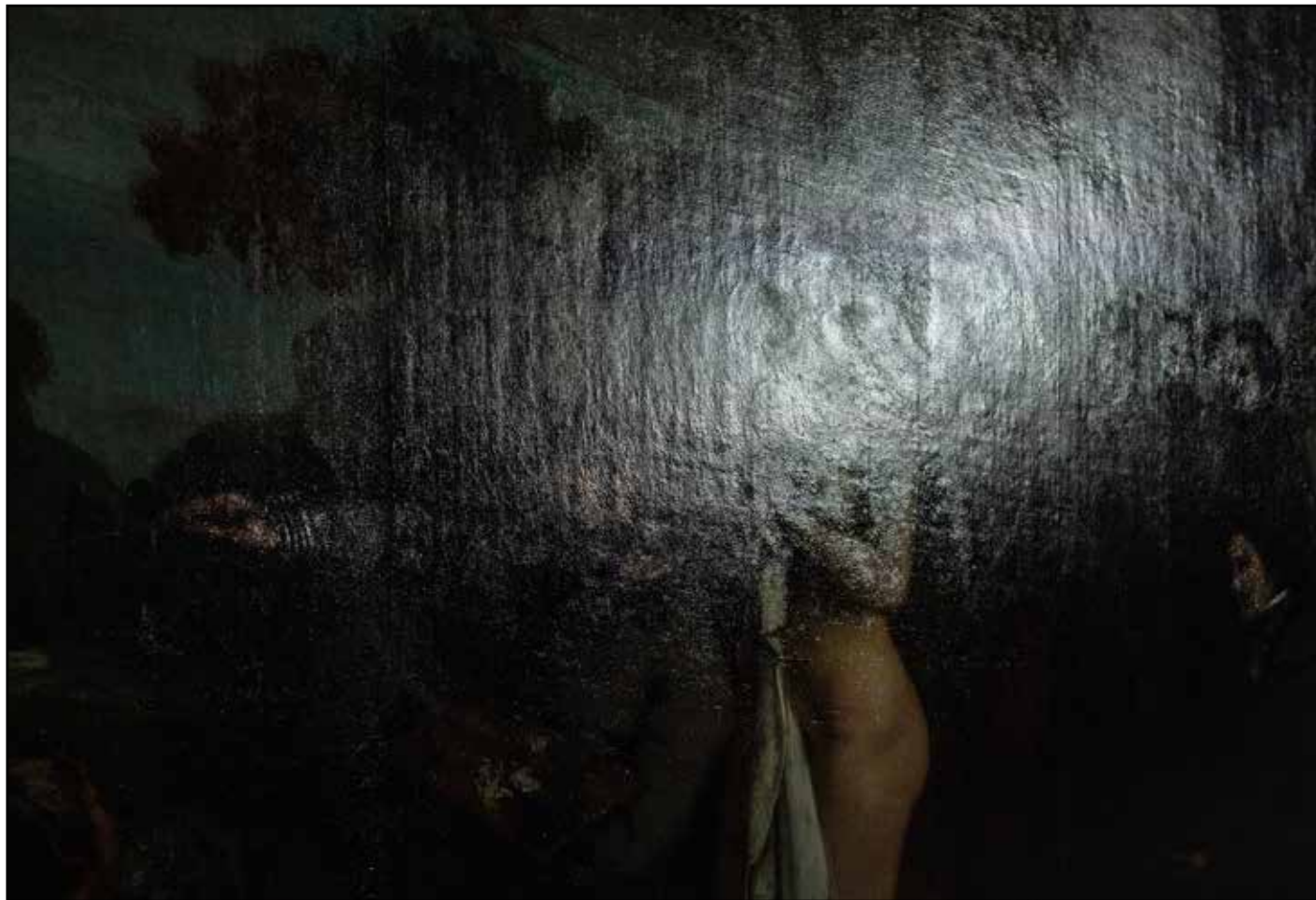
Musée d'Orsay, Paris 2025