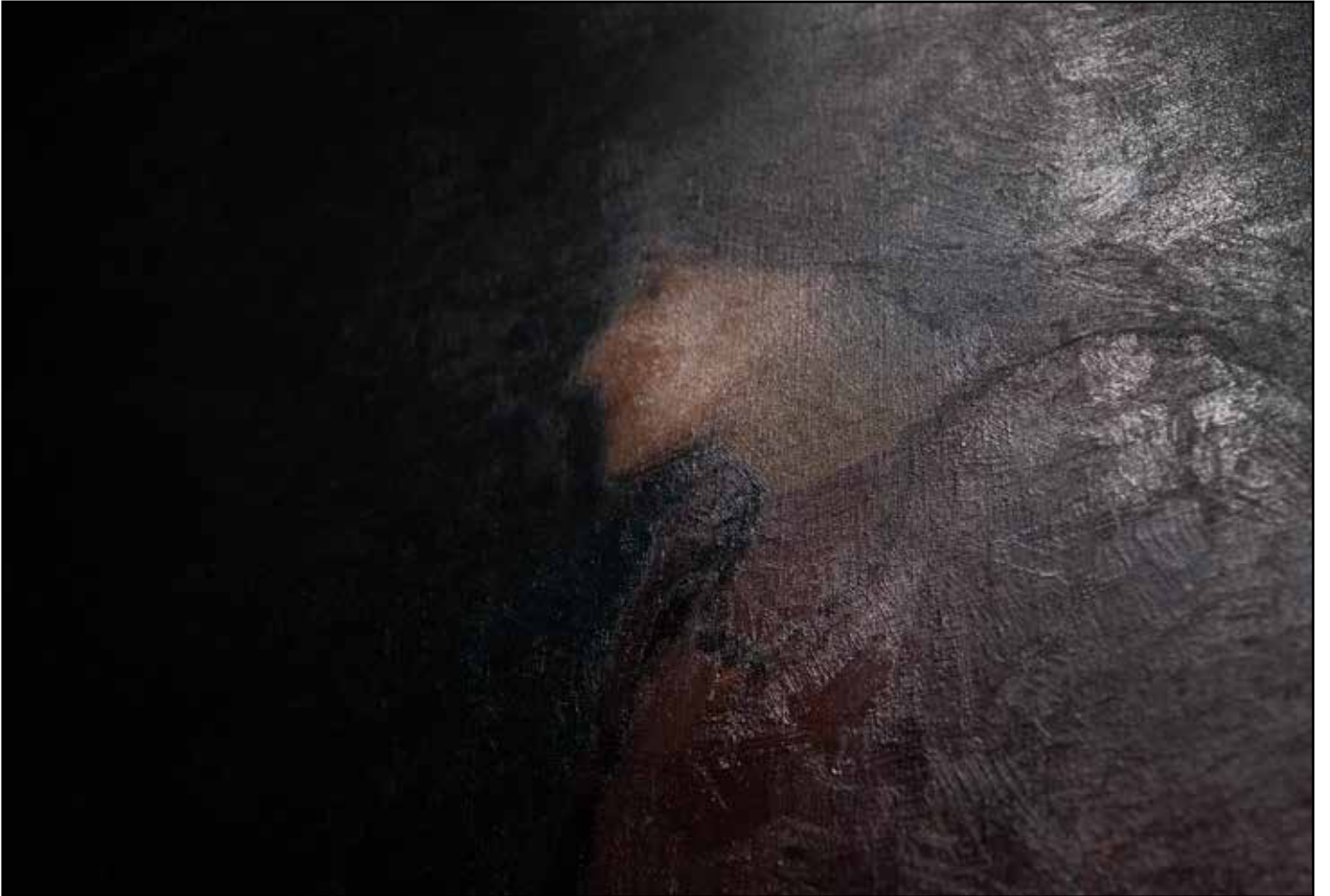
Musée d'Orsay, Paris 2025