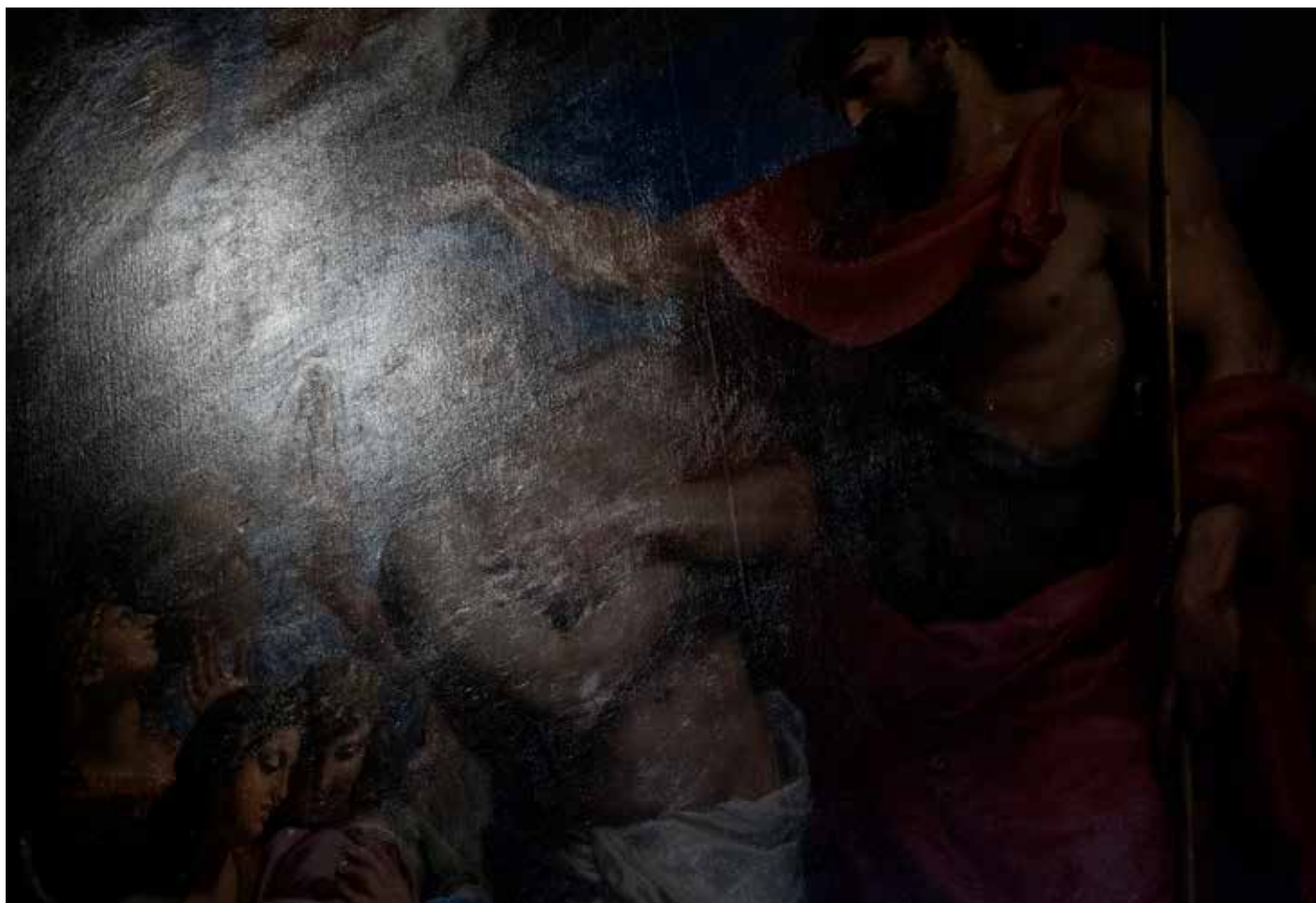
Église St. Louis en l'Île, Paris 2025